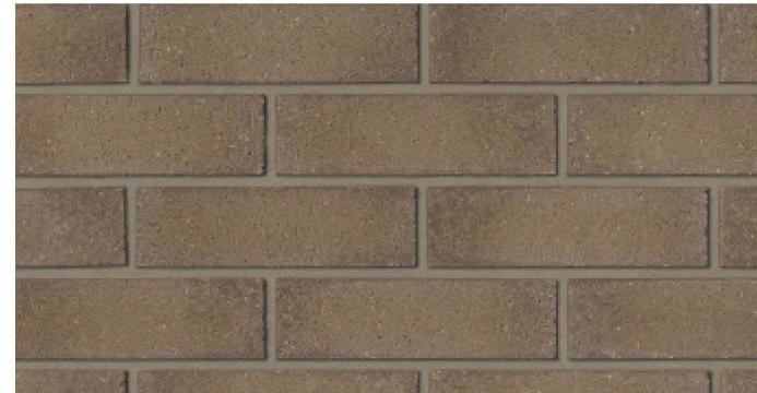
BRIQUE 2 - ACCENT :

MORTIER: FABRICANT: DAUBOIS COULEUR: ALBATRE NO: 15148S30