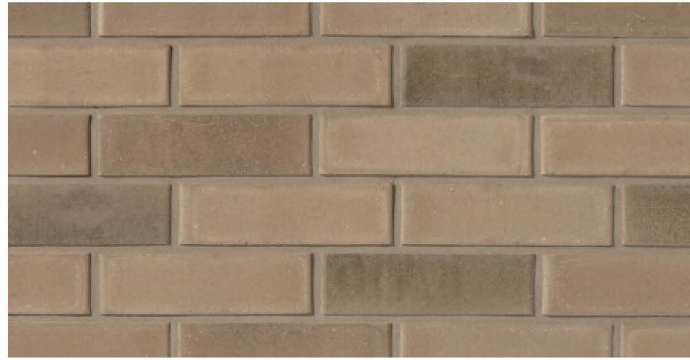
BRIQUE 1 _ GÉNÉRALE:

FABRICANT: BRAMPTON BRICK COLLECTION: CONTEMPORARY FORMAT: PRP (90 X 79 X 257 MM) COULEUR: CHELSEA